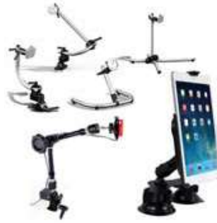
Table & Wheelchair mounting solutions

Our product range ensures very sturdy mounting for all types of devices. Whether you want to place the device on top of something - even with leveling for uneven surfaces - or whether you want to clamp to a piece of furniture.