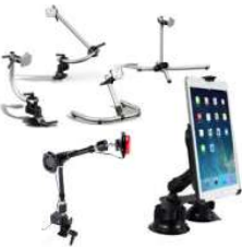
Table & Wheelchair mounting solutions

Our product range ensures very sturdy mounting for all types of devices. Whether you want to place the device on top of something - even with leveling for uneven surfaces - or whether you want to clamp to a piece of furniture.